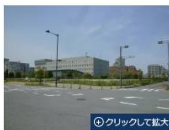
新浦安ホテル計画（仮称）の建設地

建設地は、JR新浦安駅から徒歩25分の場所にある。バスを利用すれば10分ほど。周辺には大型のマンションやホテルなどが点在しており、南側には東京湾に臨む浦安市総合公園がある。東京ディズニーランドまでは車で約15分だ。